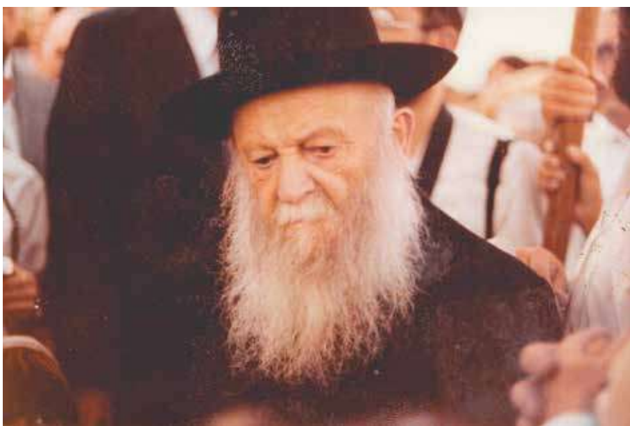
הרב צבי יהודה קוק

ענייני רב, כמובן, גם בפירוט תכנה של כתיבתך המרובה, ברוך השם, וגם בזה של דברי מלחמוניך הנפשיים. ובין שתי מערכותיך אלה הלא יחס וקשר רב. בינתיים הלא תוסיף אמן ותצליח בתפקידיך ועבודותיך - וגם בשיריך ונפשיותך. אפשר מאד כי "יעשה הזמן מה שלא יעשה השכל", ובמהלך גידולו הטבעי תתרפא הספקנות