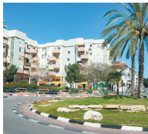
היישוב בני עי"ש

לביציון, שרואה בסב סבתו דמות ציונית, מתאר אותו בעיקר כאישיות טרגית: "הקנאים רדפו אותו