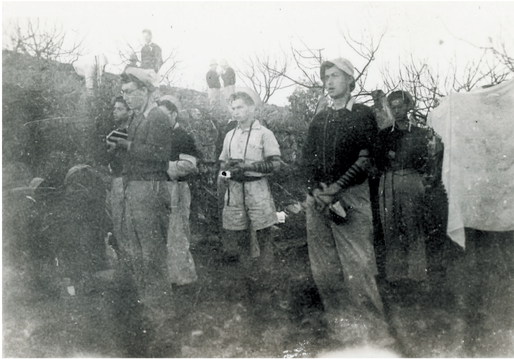
המחלקה הדתית בפלמ"ח בתפילה ליד הכפר ביתוניה

כשנתיים. הם עברו במשק, התאמנו, וחלקם נשלחו לקרסים ייחודיים ופיקודיים של הפלמ"ח. כמו מחלקות הפלמ"ח האחרות הם ערכו סיורים ומסעות ברחבי הארץ – בגליל, במצדה, בצפון, בים המלח ועוד, במטרה להכיר את האזורים השונים ולמפות את סביבות הכפרים הע"רביים. המסע לכפר-עציון בחנוכה תש"ג השאיר חותם מיוחד ותועד בכתובים.