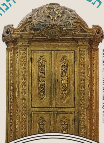
ארון הקודש של בית הכנסת האיטונבולי, ירושלים